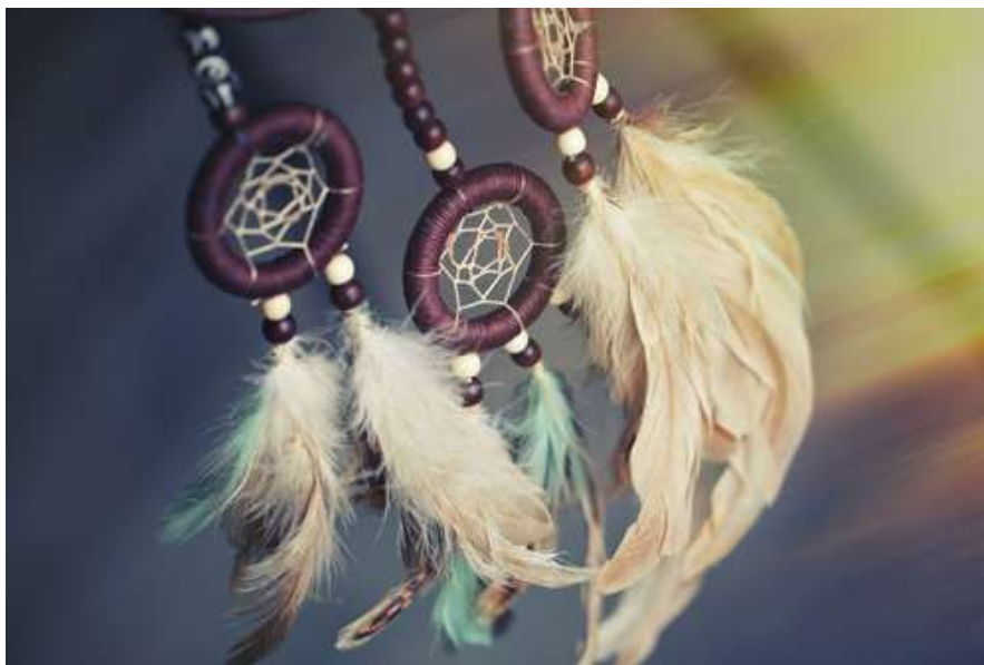
Image credit: "We exist as morphogenetic fields. Wellbeing is a constant" is one of the many bullshit phrases generated by the researchers' website.